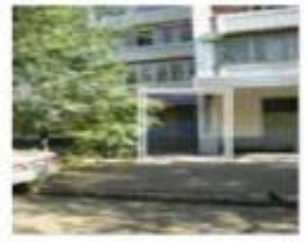
Рис. 4. Месторасположение парикмахерской

Собственнику желательно создать поток посетителей хотя бы 150 человек в неделю. Ассигнования, выделенные собственником на продвижение парикмахерской – не более 100 000 рублей. На той же улице четыре месяца назад открылась парикмахерская-конкурент на 4 посадочных места. Никаких услуг, кроме стрижки, не оказывают. Помещение крохотное, люди ждут своей очереди прямо в салоне. Работают 18-летние гастарбайтеры из Молдовы и Украины.